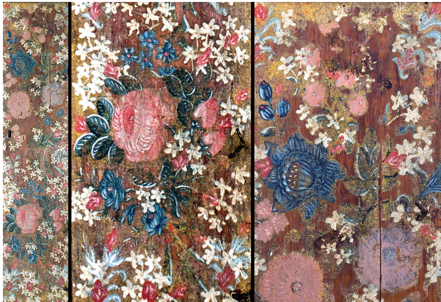
Εικ. 7: Λεπτομέρειες του άνθινου διακόσμου της ξύλινης κάσας του ρολογιού.

διάδραση, επιτρέποντας στον χρήστη την εξερεύνηση της φωτογραφημένης επιφάνειας, κυριολεκτικά φωτίζοντας την κάθε λεπτομέρεια και κατ' επέκταση αποκαλύπτοντας άγνωστες μέχρι σήμερα πτυχές της τεχνικής του καλλιτέχνη. 31 Συγκεκριμένα η εφαρμογή της τεχνικής RTI ανέδειξε τις χαράξεις των περιγραμμάτων των λεπτομερειών της εικονιζόμενης μορφής αλλά και τις ανάγλυφες πινελιές του καλλιτέχνη στην απόδοση της πλούσιας ενδυμασίας και των κοσμημάτων της «κυρίας του ρολογιού» (εικ. 6).