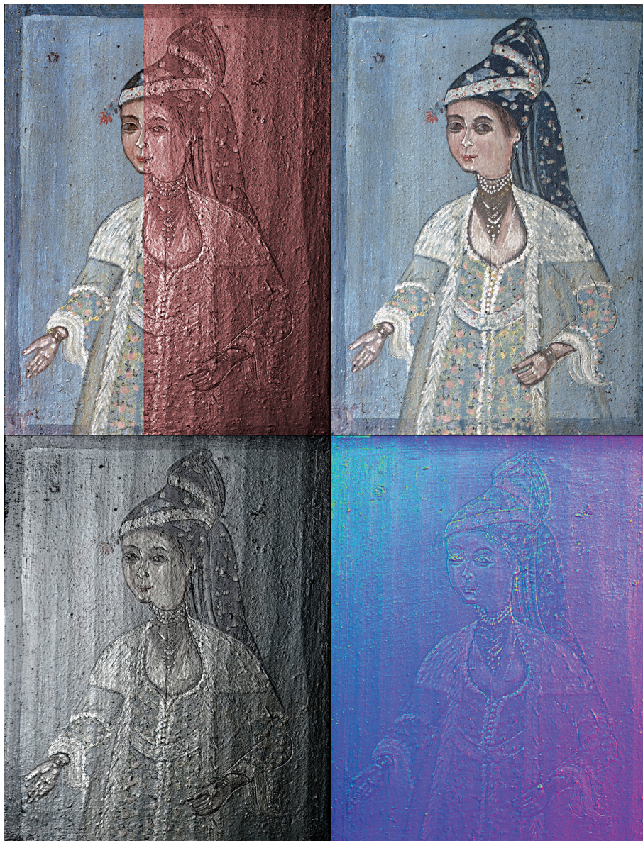
Εικ. 6: Ψηφιακές παραλλαγές της «κυρίας του ρολογιού», στις οποίες διακρίνονται οι χαραξείς των περιγραμμάτων και οι ανάγλυφες πινελιές στα ενδύματα και κοσμήματα.