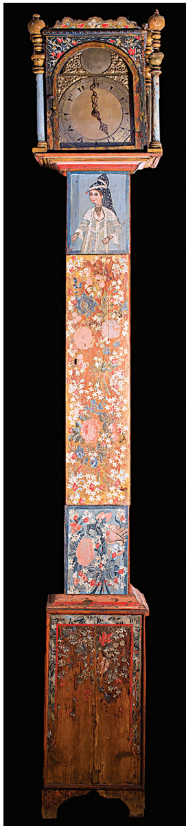
Εικ. 1: Γενική όψη του ρολογιού.