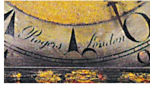
Εικ.2β: Λεπτομέρεια με το όνομα του ωρολογοποιού του Λονδίνου Isaac Rogers “Rogers London”.