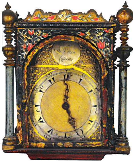
Εικ. 2α: Το ρολόι μέσα στη θήκη του.