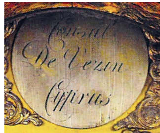
Εικ. 2γ: Πλάκα με το όνομα του κατόχου του ρολογιού “Consul De Vezin Cyprus”.

διακοσμημένη ξύλινη θήκη. Βρίσκεται στην εκκλησία του Αγίου Αντωνίου, στη Λευκωσία 6 . Του ίδιου τύπου ρολόι (ύψους 1,98 μ.) με απλούστερο διάκοσμο (ήλιο και σελήνη), εκτίθεται στο Μουσείο Λαϊκής Τέχνης της Εταιρείας Κυπριακών Σπουδών και ανήκε στον καθεδρικό ναό του Αγίου Ιωάννη του Θεολόγου. Τέτοια ρολόγια σώζονται και σε άλλες εκκλησίες, όπως στον ναό της Φανερωμένης, όπου φυλάσσονται τρία, επίσης ένα στον Άγιο Σάββα 7 . Η παρουσία