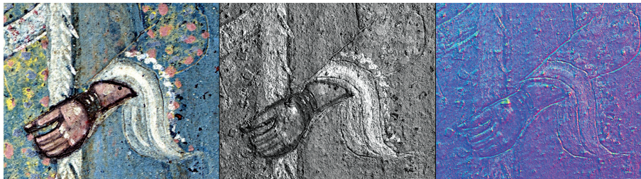
Εικ. 5: Απεικόνιση του αριστερού χεριού της «κυρίας του ρολογιού» με ψηφιακή φωτογράφιση (RTI).

αγιογράφου υποδηλώνει η σχηματική απόδοση κάποιων λεπτομερειών (π.χ. τα χέρια), ακόμη και η τεχνική της εγχάραξης περιγραμμάτων, ίσως με τη χρήση ανθιβόλων, που αποκαλύφθηκαν με την εφαρμογή της τεχνικής ψηφιακής φωτογράφισης Reflectance Transformation Imaging (RTI) (εικ. 5).