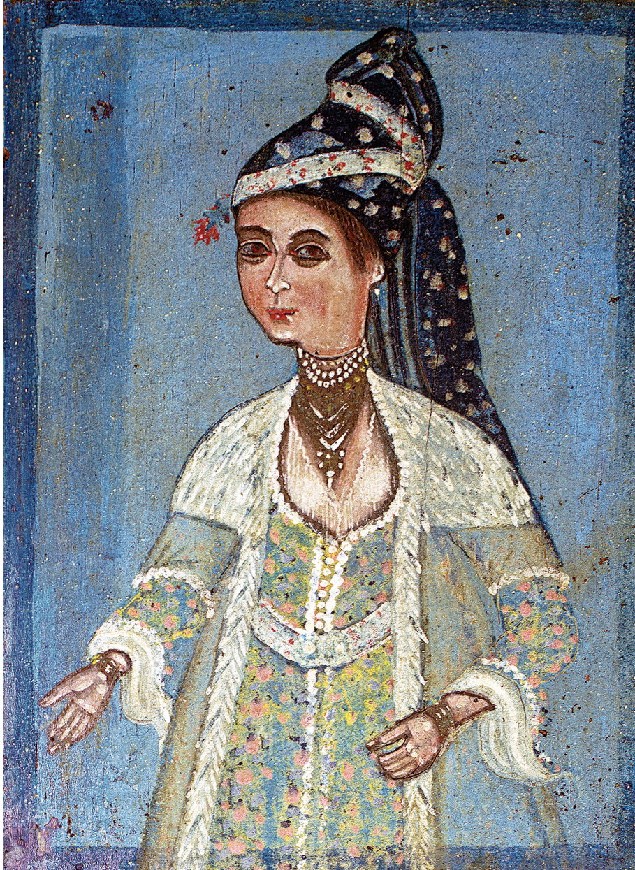
Εικ. 3: Η «κυρία του ρολογιού».