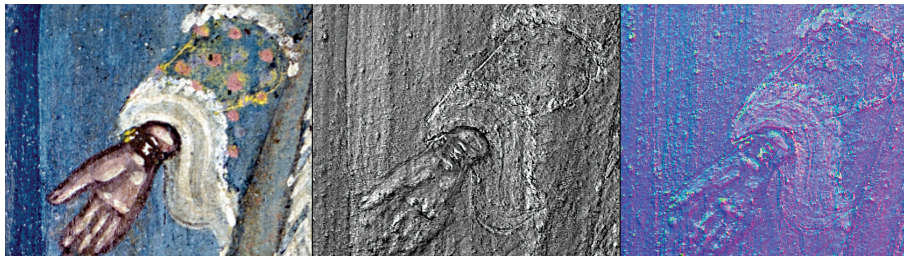
Εικ. 9: Απεικόνιση της δεξιάς παλάμης της «κυρίας του ρολογιού», σε διαφορετικές ψηφιακές παραλλαγές.

Χατζηγεωργάκη (εικ. 8), αλλά και σε πολλά άλλα αρχοντικά ανά την οθωμανική επικράτεια 33 .