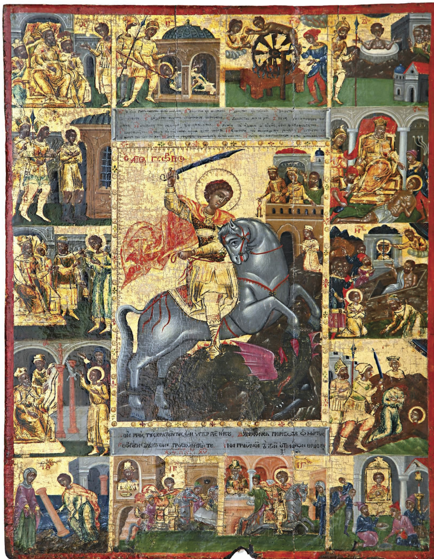
Εικ. 1α: Εικόνα του Αγίου Γεωργίου (1786) από την εκκλησία του Αγίου Ιακώβου του Πέρση. Εκκλησία Αγίου Σπυρίδωνος, Λευκωσία.