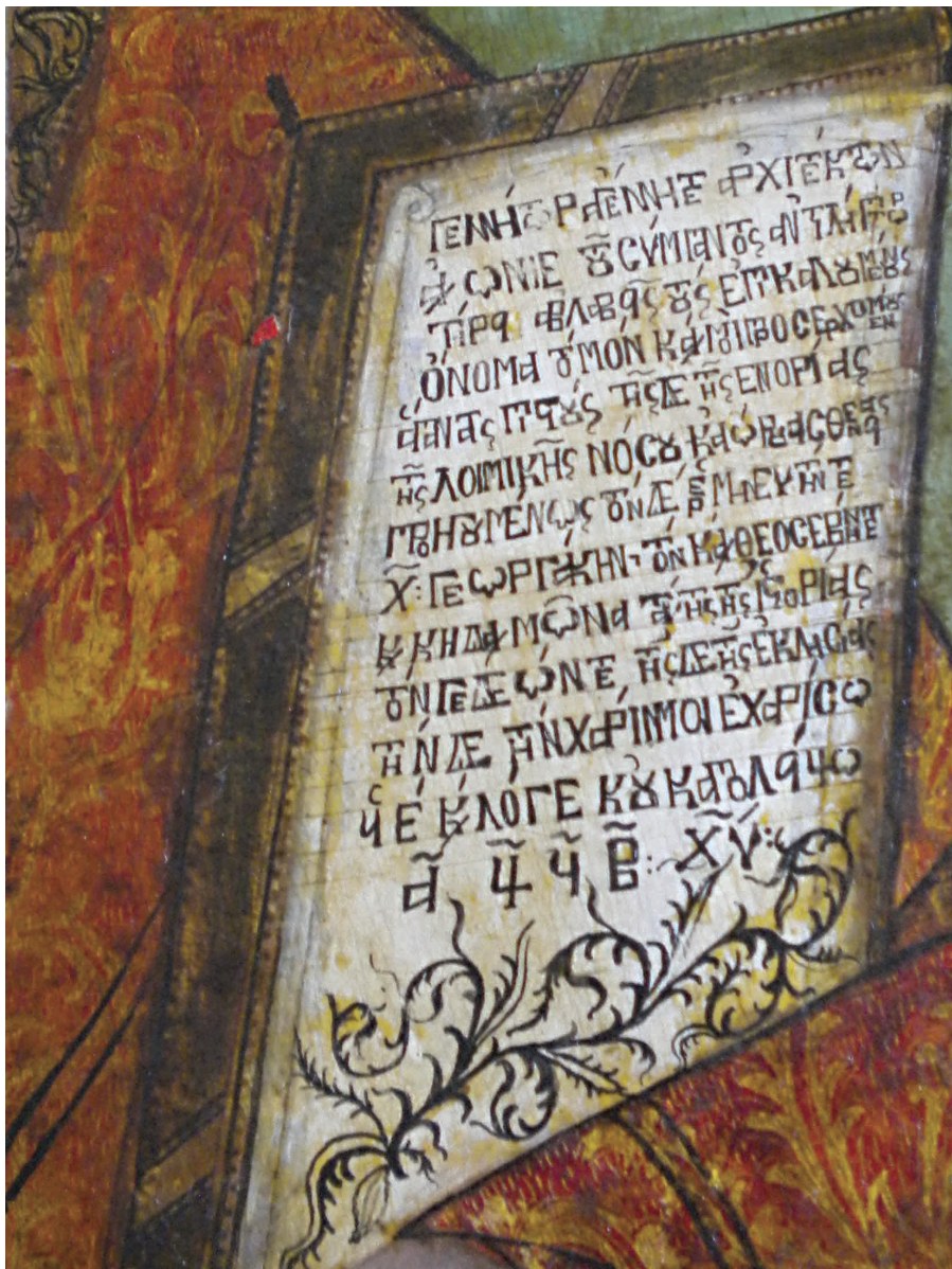
Εικ. 7β: Αφιερωματική επιγραφή στην εικόνα του Αγίου Χαλαλάμπους.