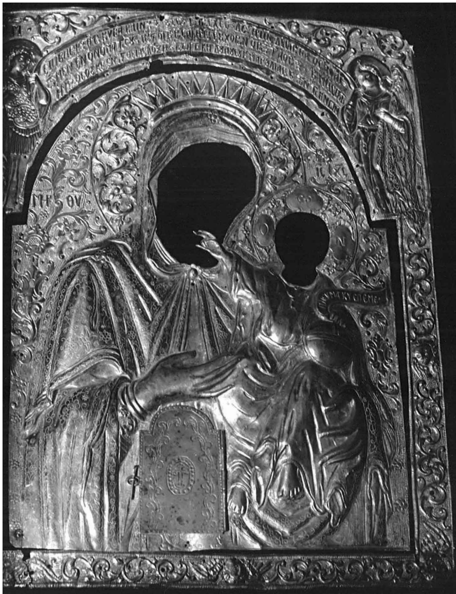
Εικ. 8α: Αργυρή επένδυση εικόνας της Παναγίας, στην εκκλησία του Αγίου Αντωνίου, Λευκωσία. Φωτ. Αρχείο Τμήματος Αρχαιοτήτων (1990).