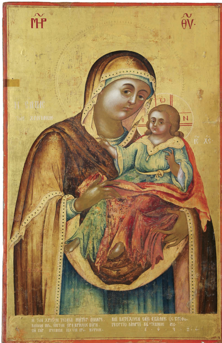
Εικ. 4α: Εικόνα της Παναγίας (1797) από το τέμπλο της εκκλησίας του Αγίου Ιακώβου του Πέρση. Εκκλησία Αγίου Σπυρίδωνος, Λευκωσία.