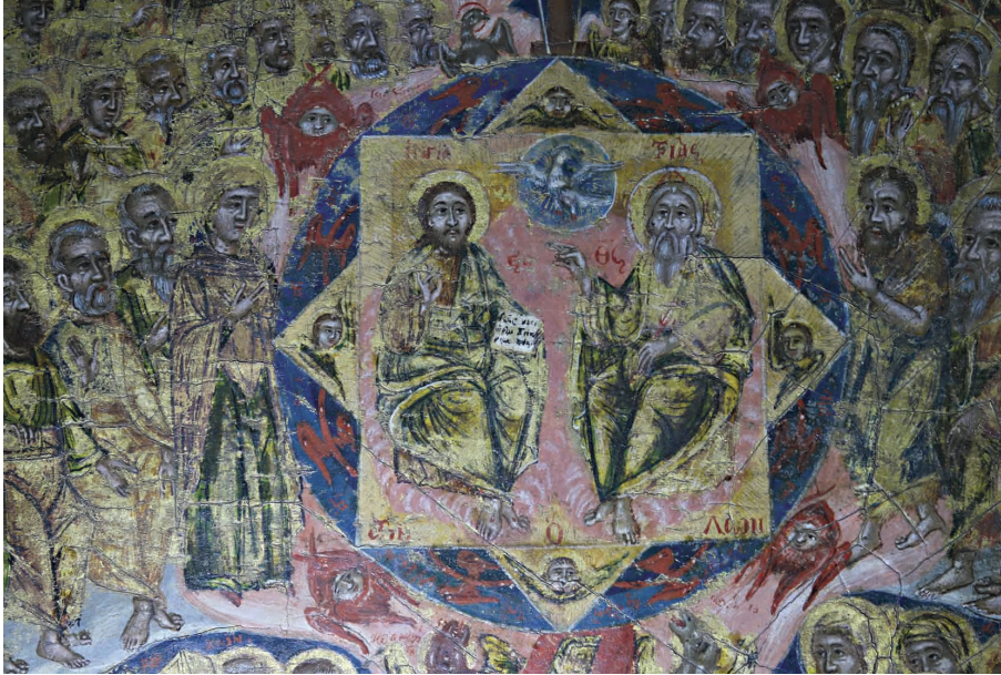
Εικ. 2β: Η Αγία Τριάς, λεπτομέρεια της εικόνας των Αγίων Πάντων.

την επιγραφή «και λέγοντες». Στο κάτω μέρος του ίδιου κύκλου εικονίζεται η Ετοιμασία του Θρόνου, με τα σύμβολα των άλλων δύο Ευαγγελιστών εκατέρωθεν, τον λέοντα αριστερά με την επιγραφή «κεκραγόντες» και τον βουν δεξιά με την επιγραφή «βοώντες», η οποία είναι δυσδιάκριτη. Η ανάγνωση στη σωστή σειρά, είναι χιαστί, παρόμοια με την κίνηση του ιερέα πάνω από το άγιο δισκάριο. Παρόμοια διάταξη παρατηρείται και στα εξαπτέρυγα.