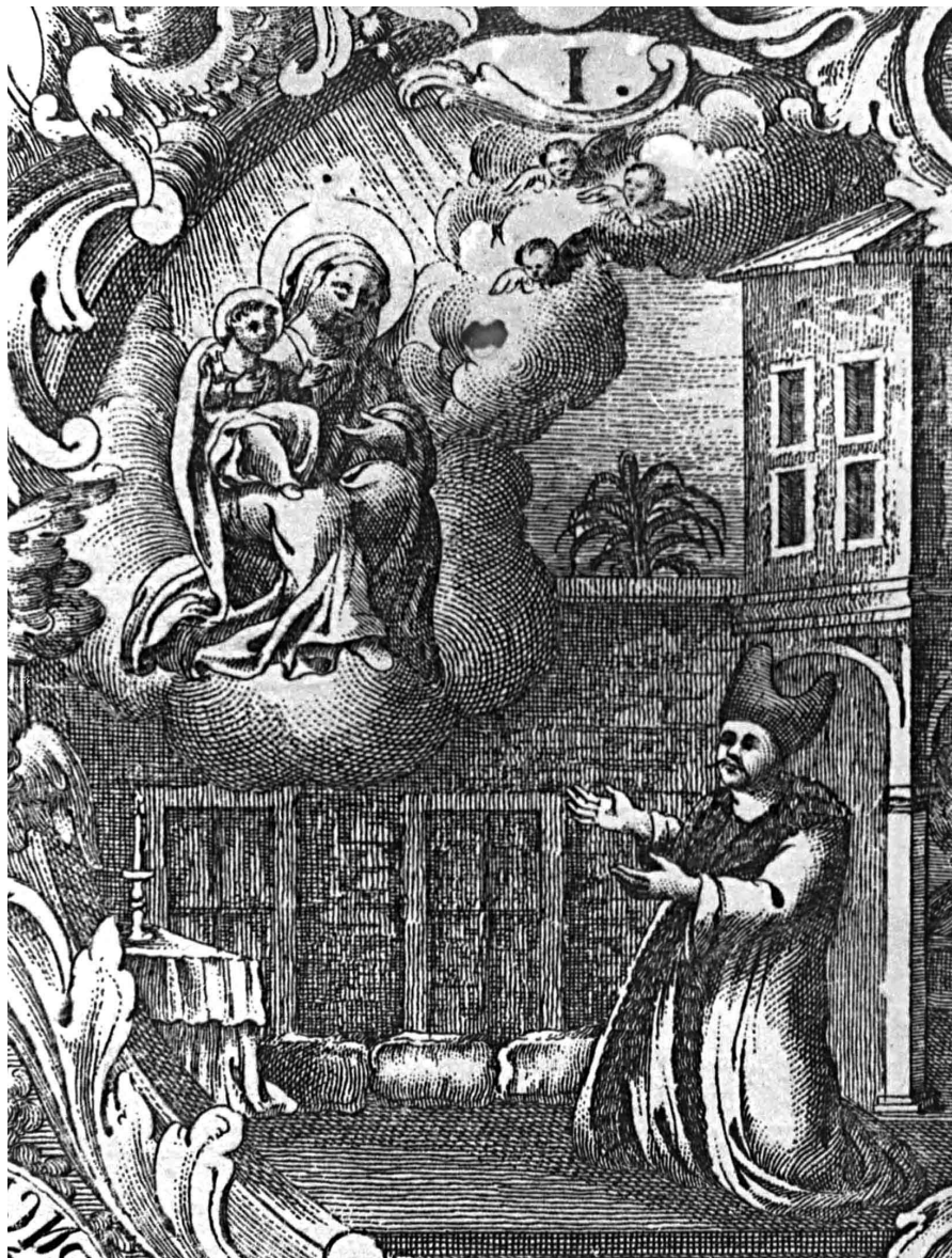
Εικ. 10: Λεπτομέρεια (σκηνή Γ) από τη χαλκογραφία «Παναγία η Χρυσορροιάτισσα», του Ιωάννη Κορνάρου (1801). Ο Χατζηγεωργάκης γονατιστός οραματίζεται την Θεοτόκο.