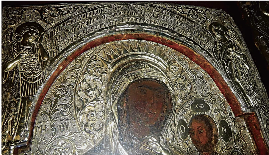
Εικ. 8β: Αφιερωματική επιγραφή Χατζηγεωργάκη στην αργυρή επένδυση της εικόνας της Παναγίας.

τήματα είναι παρόμοια με εκείνα άλλων αναθηματικών επιγραφών.