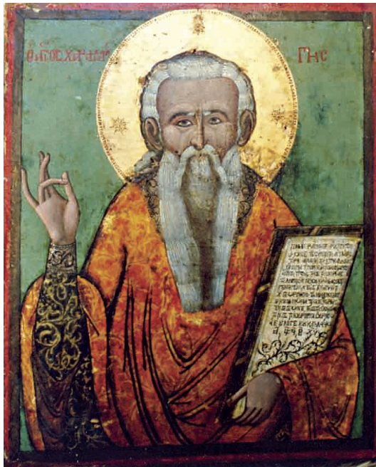
Εικ. 7α: Εικόνα του Αγίου Χαραλάμπους (1792), στην εκκλησία του Αγίου Αντωνίου, Λευκωσία.

Εικόνα του Αγίου Χαραλάμπους, διαστάσεων 36,3 x 30 εκ. (Εικ. 7α). Το όνομα είναι γραμμένο εκατέρωθεν του φωτοστέφανου ως