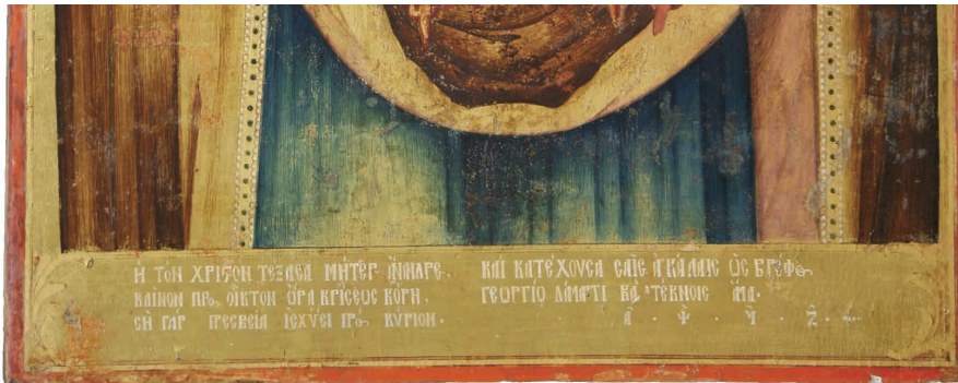
Εικ. 4β: Αφιερωματική επιγραφή του Χατζηγεωργάκη στην εικόνα της Παναγίας. Φωτ. π. Θωμά Κωστή.

τα τέκνα του, έχοντας επίγνωση της ισχύος της μεσολάβησής της προς τον Κύριο.