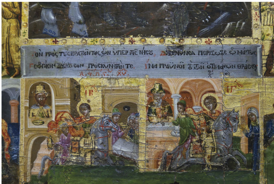
Εικ. 1β: Αφιερωματική επιγραφή του Χατζηγεωργάκη στην εικόνα του Αγίου Γεωργίου. Φωτ. π. Θωμά Κωστή.

κεντρική εικόνα. Οι σκηνές αποδίδονται σε μικρογραφία, με αφηγηματικό τρόπο. Φέρουν αριθμηση με τα γράμματα του αλφαβήτου, τα οποία αντιστοιχούν στα γράμματα των επεξηγηματικών επιγραφών, γραμμένων στη σειρά σε ανοικτό, γκριζωπό ειλητάριο, πάνω από την απεικόνιση του Αγίου Γεωργίου, ως εξής: «Α'ον Ο άγιος παρρησιάζεται εις τον Βασιλέα. Β'ον Βάλλεται εις φυλακήν. Γ'ον Δένεται εις τροχόν. Δ'ον Βάλλεται εις τον λάκκον της ασβέστου. Ε'ον Βάλλεται σιδηρά υποδήματα πυρωμένα. ΣΤ'ον Δαίρεται κατά γης. Ζ'ον Πίνει θανατηφόρα φάρμακα. Η'ον Αναστήνει τον νεκρόν και φυλακίζεται. Θ'ον Ρίπτει τα είδωλα δι' ευχής, όθεν και αποφασίζεται. Ι'ον Καρατομείται. ΙΑ'ον Στέλλει τον της χήρας κίονα εις τον ναόν του. ΙΒ'ον Ελευθερεί τον αιχμάλωτον γεώργιον. ΙΓ'ον λυτρούται εκ του αμηνρά τον υιόν της χήρας. ΙΔ'ον Διά τινος σφογγάτου θαυματουργεί εις τους ναύτας. ΙΕ'ον σώζει την βασιλόπαιδα εκ της