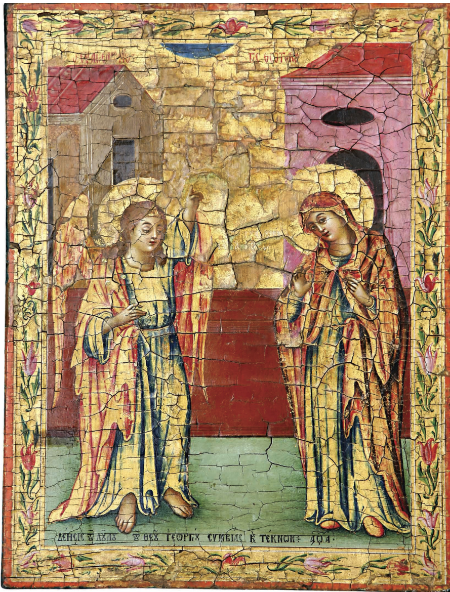
Εικ. 5: Εικόνα του Ευαγγελισμού της Θεοτόκου (1801) από την εκκλησία του Αγίου Ιακώβου του Πέρση. Εκκλησία Αγίου Σπυρίδωνος, Λευκωσία.