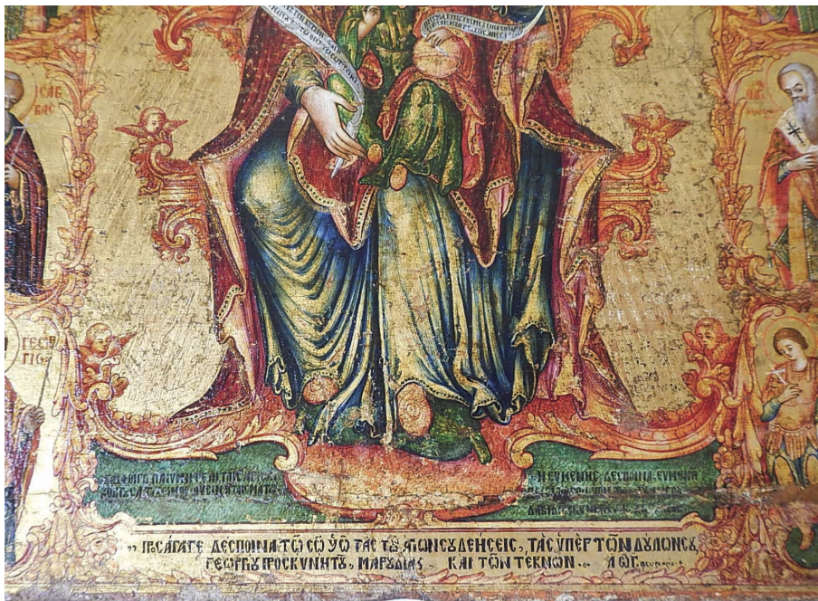
Εικ. 9β: Αφιερωματική επιγραφή Χατζηγεωργάκη στην εικόνα της Παντάνασσας.

νασσας, η λέξη «αισθήσεων» αντί «ΑΙΣΤΗΤΙΚΗ», και η τελευταία λέξη «Τριάδος» αντί «ΕΠΤΑΔΟΣ» της επιγραφής.