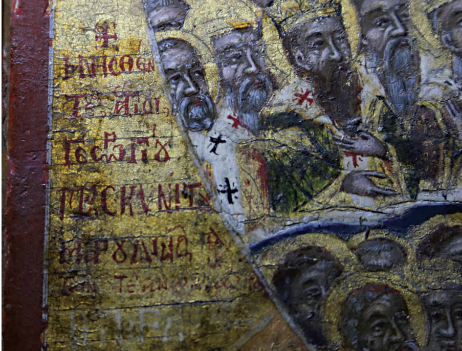
Εικ. 2γ: Αφιερωματική επιγραφή του Χατζηγεωργάκη στην εικόνα των Αγίων Πάντων.

πιο κάτω, όπου υπάρχει η αρχή της επιγραφής «ΠΑΡΑ» του Παραδείσου, γραμμένη με λευκά γράμματα. Παρόμοιες χαρακτές γραμμές υπάρχουν στον αντίστοιχο χώρο έξω από τον κύκλο στη δεξιά πλευρά, με κάποια άλλη επιγραφή, η οποία δεν διακρίνεται καθόλου.