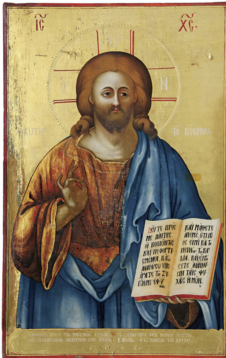
Εικ. 3α: Εικόνα του Χριστού (1797) από το τέμπλο της εκκλησίας του Αγίου Ιακώβου του Πέρση. Εκκλησία Αγίου Σπυρίδωνος, Λευκωσία.