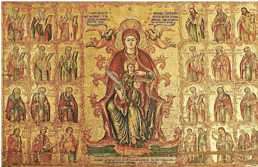
Εικ.9α: Η Μήτηρ Θεού η Παντάνασσα (1803), εικόνα στην εκκλησία του Αγίου Αντωνίου, Λευκωσία.

ντυμένη με πολύπτυχο χιτώνα, πράσινο με χρυσές ανταύγειες, και με μαφόριο από βαθυκόκκινο ύφασμα με διακοσμητικά μοτίβα και χρυσή παρυφή. Τον γιακά του χιτώνα στο κέντρο, κοσμεί κεφαλή αγγέλου με πτερά. Το κιτρινωπό υπόδημά της, το οποίο προβάλλει κάτω από τον χιτώνα, πατώντας σε πράσινο μαξιλάρι/υποπόδιο, κοσμείται επίσης με αγγελική μορφή. Στον κόλπο της κρατεί τον Χριστό, ο οποίος κάθεται μετωπικά και φορεί χρυσό στέμμα και ενδύματα των ίδιων χρωμάτων με της Θεοτόκου. Αξιοπρόσεκτος είναι ο πλατύγυρος γιακάς του χιτώνα, ο οποίος εμφανίζεται και σε άλλες εικόνες. Ο Χριστός ευλογεί με το δεξί χέρι και στηρίζει σφαίρα στο γόνατό του με το αρι-