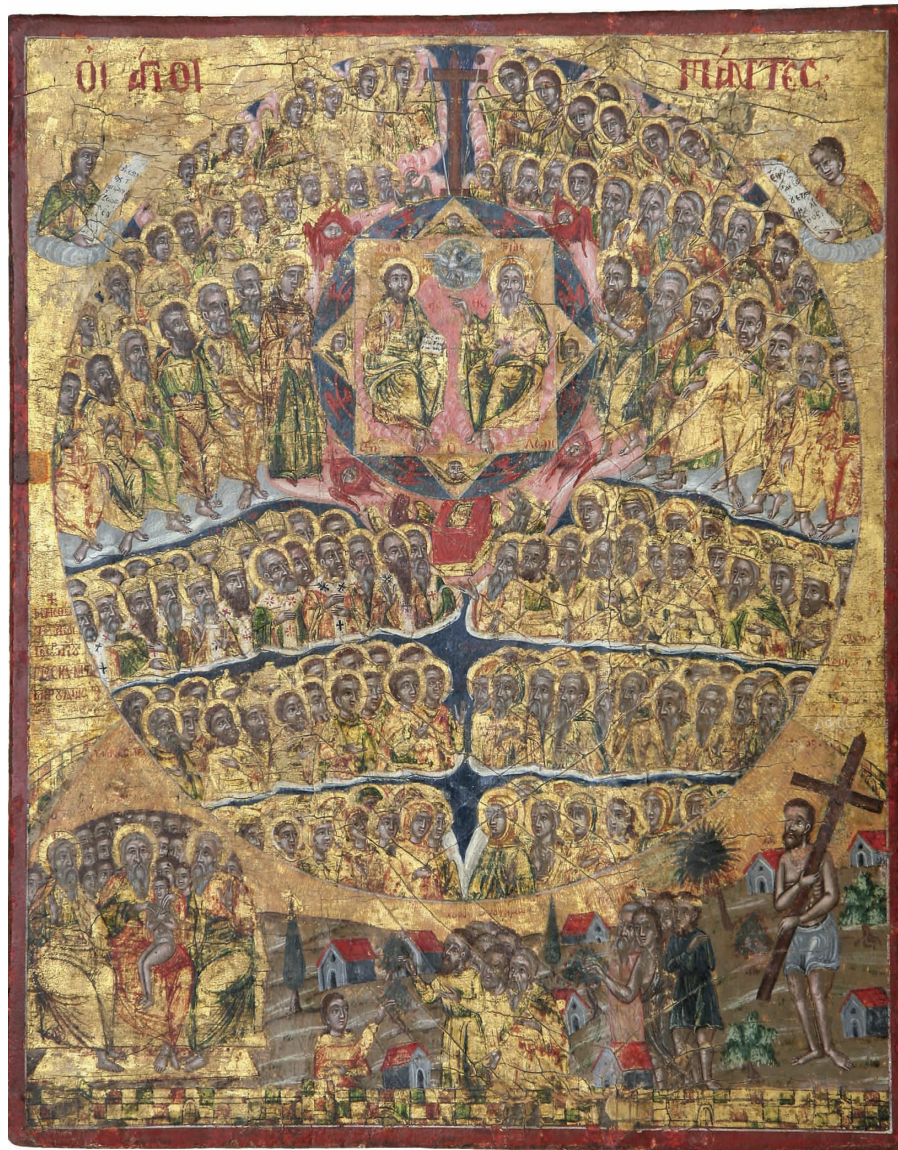
Εικ. 2α: Οι Άγιοι Πάντες. Εικόνα από την εκκλησία του Αγίου Ιακώβου του Πέρση. Εκκλησία Αγίου Σπυρίδωνος, Λευκωσία.