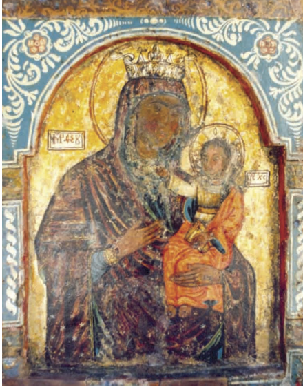
Εικ. 8γ: Εικόνα της Παναγίας κάτω από την αργυρή επένδυση.

τιο, το οποίο έχει μπλε υπένδυση. Ύψώνει το δεξί χέρι στον λαιμό της Θεοτόκου, σε κίνηση ευλογίας, όπως και στο αργυρό κάλυμμα. Στον φωτοστέφανο επαναλαμβάνονται τα γράμματα «Ο ΩΝ». Σε άλλα σημεία, όμως, υπάρχουν διαφορές, οι οποίες δείχνουν ότι δεν επιδιώχθηκε απόλυτη ανταπόκριση μεταξύ της εικόνας και του καλύμματός της. Μια εμφανής διαφορά είναι ότι στην εικόνα ο Χριστός δεν κρατεί με το αριστερό χέρι σφαίρα και ειλητάριο, αλλά κλειστό βιβλίο. Η συντομογραφία «IC XC», μέσα σε διπλό ορθογώνιο πλαίσιο, βρίσκεται πολύ χαμηλότερα από τη θέση της στο κάλυμμα, ενώ η επιγραφή «MP ΘΕΟΥ», πάνω από τον δεξιό ώμο της Θεοτόκου, έχει τη δεύτερη λέξη ολογράφως. Διαφορές παρουσιάζει και το στέμμα της Παναγίας, το οποίο στην εικόνα έχει πολύ πιο περίτεχνο γραπτό διάκοσμο στην ταινία του, και ολόγυρα τρίγωνα με άνθη στην κορυφή